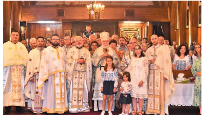
Vizita Arhierasca la Catedrala Buna Vestire din Montreal, QC - 12 aug. 2018.