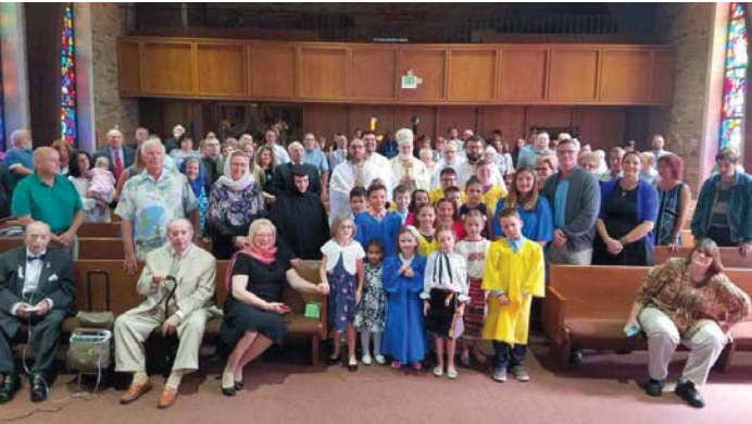
110 ani ai Parohiei Pogorârea Duhului Sfânt, Merrillville, IN - 16 sept 2018.