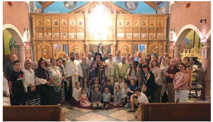
Parohia Sf. Maria Magdalena, Houston TX - Aniversarea de 25 de ani - 23 sept. 2018.