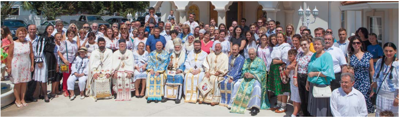
Aniversarea de 25 de ani a Parohiei Sfanta Ana, Jacksonville, FL - 19 aug. 2018.