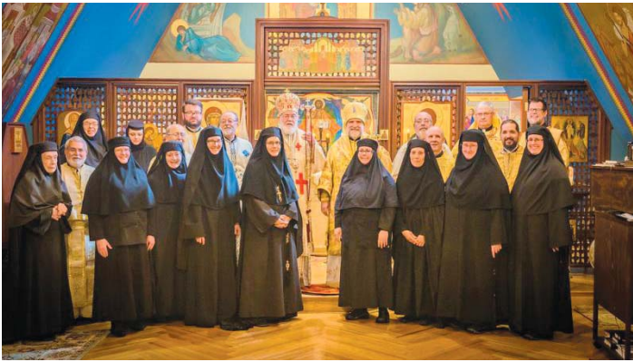
Aniversarea de 50 de ani de la sfințirea Mănăstirii Schimbarea la Față din Ellwood City, PA - 28 sept. 2018.