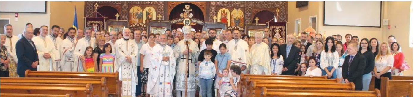
Vizita Arhierasca la Parohia Acoperamantul Maicii Domnului, Pierrefonds, QC - 11 aug. 2018.