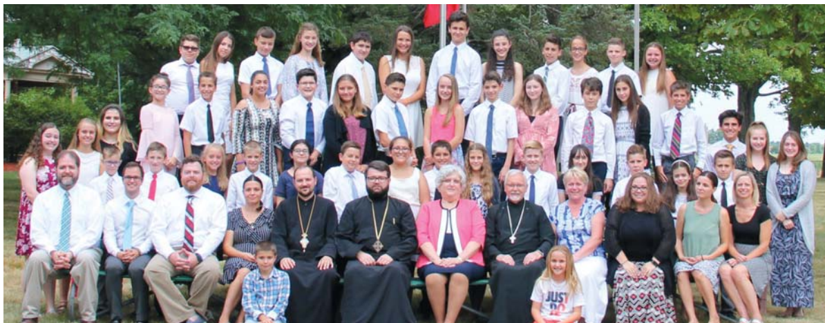
Tabara pentru Juniori de la Vatra Romaneasca, Grass Lake, MI, 22 iulie - 4 aug. 2018.