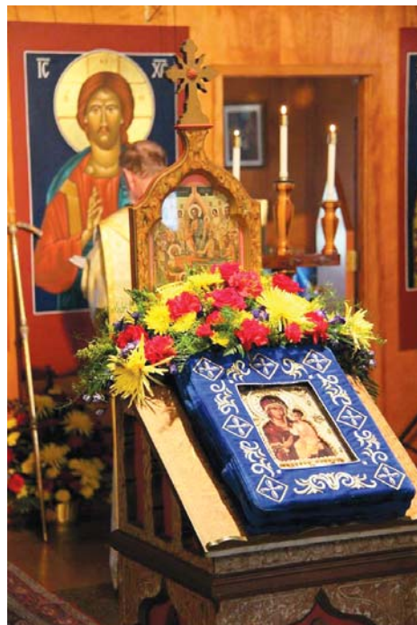
Hawaiian Myrrh-Streaming Icon of the Iveron Mother of God

“We recently concluded the 19th All-American Council with the theme, ‘For the Life of the World,’” Metropolitan Tikhon observed. “I personally was reinvigorated every day of the Council and encouraged by the lively discussions that took place in the forums and in my one-on-one interactions with the delegates. It was all inspiring and, in a very concrete way, life-giving. “I was also encouraged by the positive response to the document I had prepared, Of What Life Do We Speak? ,” Metropolitan Tikhon continued. “The subtitle to that work is ‘Four Pillars for the Fulfillment of the Apostolic Work of the Church,’ and it was clear to me, especially from the inspiring testimonies offered by each of our