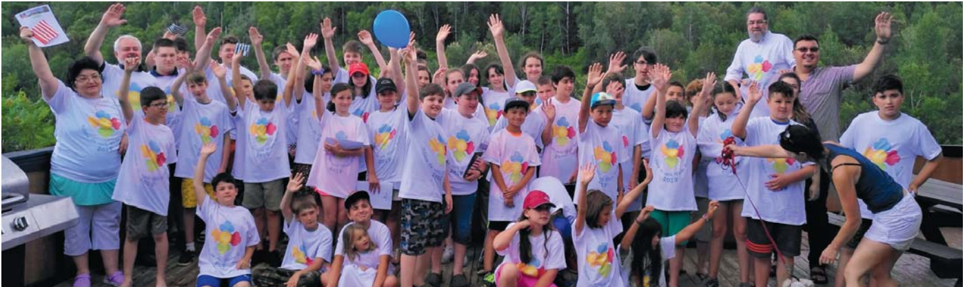
Tabara de Vara Sfanta Maria a Protopopiatului Canada de Est, Montreal, Quebec, 1-7 iulie 2018.