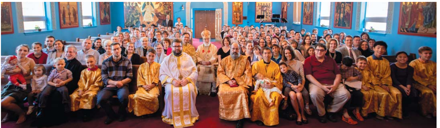
Sarbatoreirea a 30 de ani de la infiintarea Parohiei Sfanta Maria din Falls Church, VA - 30 sept. 2018.