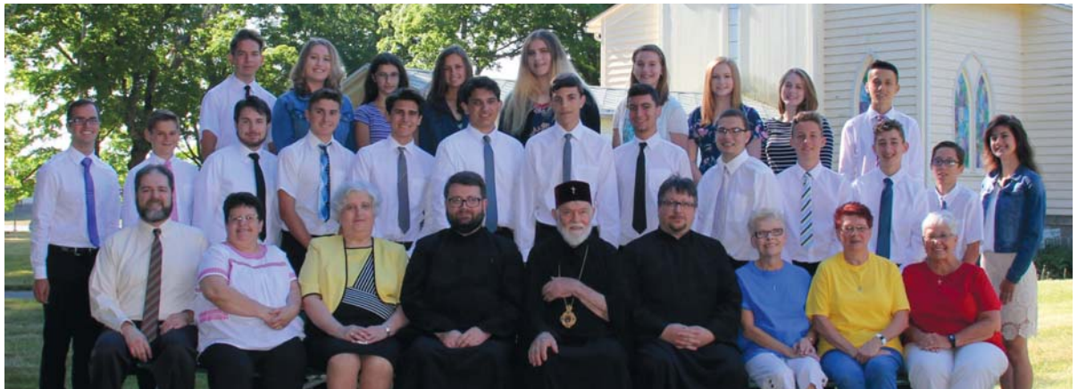
Tabara de Seniori de la Vatra Romaneaca, Grass Lake, MI, 1-14 iulie 2018.